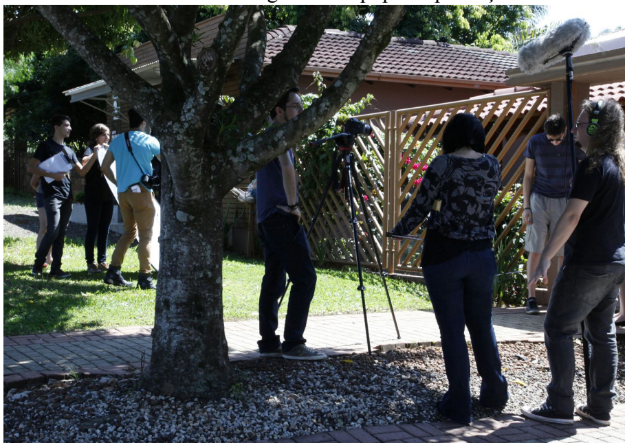
Figura 3 - Equipe de produção