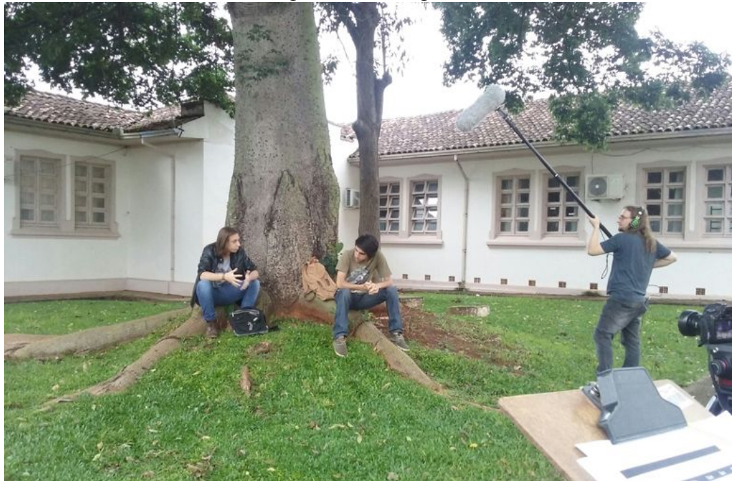
Figura 1 - Making off de cena

Os atores foram selecionados a partir de um teste de elenco, depois disso foram feitos alguns ensaios e leituras de roteiro. O episódio foi gravado em três diárias, que iniciavam às 7:00h e terminavam às 18:30h. Para a filmagem foram utilizadas as câmeras Canon EOS 5D Mark II, Canon EOS 70D e Canon EOS 7D e para a captação de som direto foi utilizado o microfone Shotgun, conforme figura 1 e 3. A equipe utilizou tabelas e planilhas durante as gravações, para uma melhor organização, conforme figura 2. Terminadas as filmagens, o material seguiu para a montagem e finalização, que aconteceram com acompanhamento da direção.