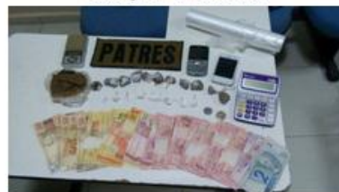
droga e muito dinheiro apreendidos

A dupla foi apreendida e apresentada na Delegacia de Polícia de Pronto Atendimento